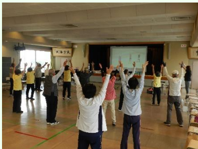
▲健康フェスティバル・運動会