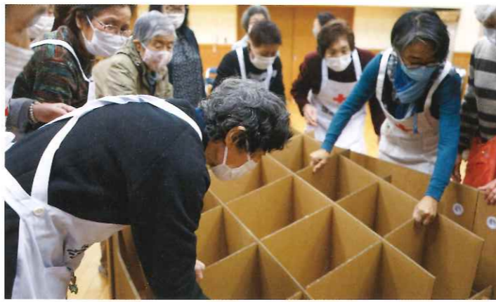
▲地域配備の赤十字段ボールベッドの組み立て訓練を行う奉仕団員

各地域の地域赤十字奉仕団や専門的な技術をもった特殊赤十字奉仕団が、地域に根ざしたさまざまな奉仕活動を展開しています。