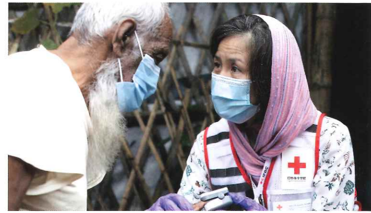
▲バングラデシュの診療所で活動する日本赤十字社の看護師

災害や紛争、病気、感染症などで苦しんでいる世界の人々を救うために、救援救護活動や医療支援を行っています。