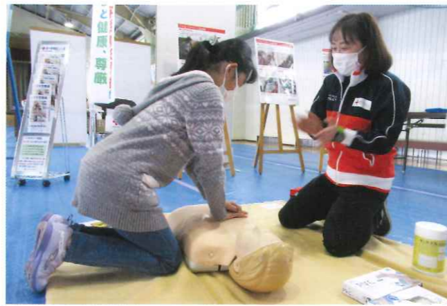
▲心肺蘇生法の実技指導を行う赤十字救急法指導員