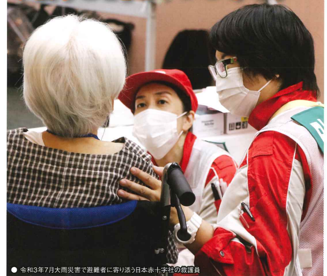
●令和3年7月大雨災害で避難者に寄り添う日本赤十字社の救護員