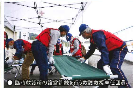
●臨時救護所の設営訓練を行う救護救援奉仕員

日本赤十字社は、「苦しんでいる人を救いたい」という思いを集結して、皆様から寄せられる日本赤十字社活動支援費(日赤社費)で、いのちと健康、尊厳を守る人道活動を行っています。