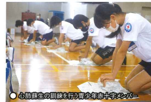
●心肺蘇生の訓練を行う青少年赤十字クラブ