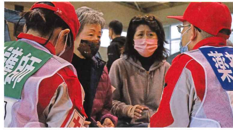
▲避難者の健康状態や服薬の状況等を確認する徳島県支部の救護員 (令和3年度中国・四国各県支部合同災害救護訓練)

日本赤十字社では全国で五百班、四千五百人の救護員を常備。徳島県支部でも救護班を七班、DMATチームを編成し、連携を図りながら災害に備えています。