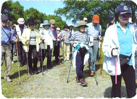
10月13日 ノルディック・ウォーク講習会 元気に歩きましょう！