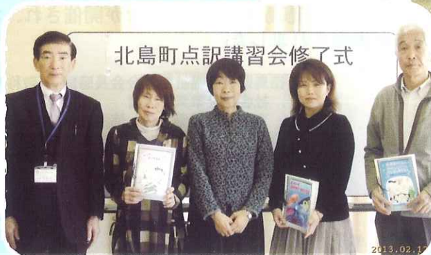
2月12日 北島町点訳講習会修了式 無事に作品ができあがりました