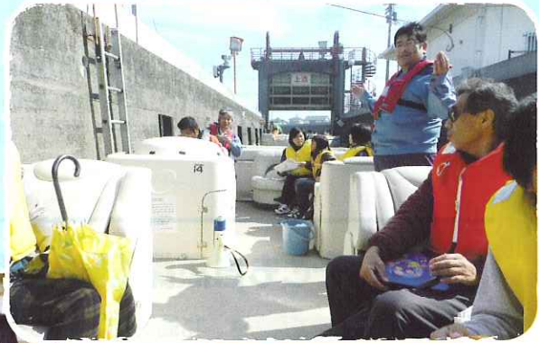
10月27日 ひょうたんクルージング 川から見る風景は違います