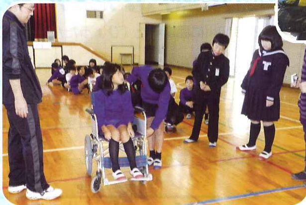
11月19日 車いす体験 (北島小学校) 上手にできるかな