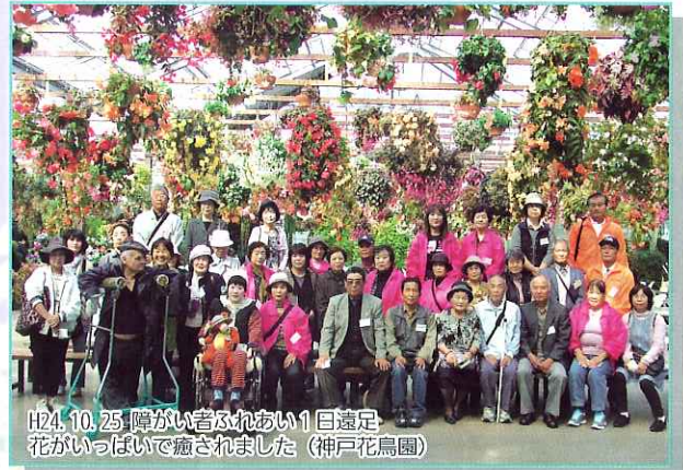
H24. 10. 25 障がい者ふれあい1日遠足 花がいっぱいで癒されました (神戸花園)