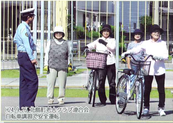
H24. 9. 26 北島町老人クラブ連合会 自転車講習で安全運転