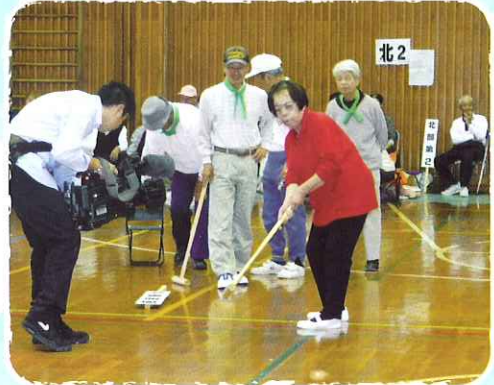
10月19日 北島町老人クラブ連合会 運動会 優勝めざしてがんばって！