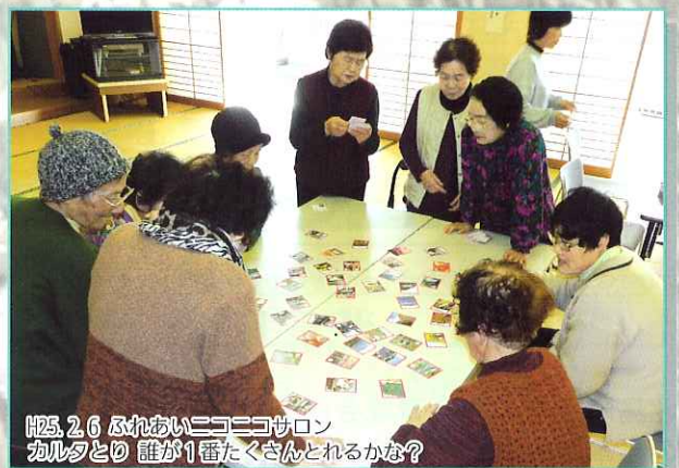
H25. 2. 6 ふれあいニコニコサロン カルタとり 誰が1番たくさんとれるかな?