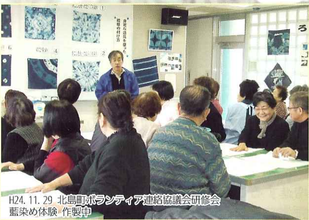
H24. 11. 29 北島町ボランティア連絡協議会研修会 藍染め体験 作製中