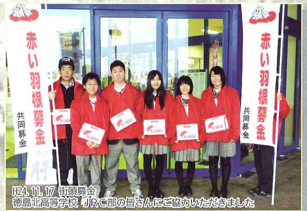
H24. 11. 17 街頭募金 徳島北高等学校 JRC部の皆さんにご協力いただきました