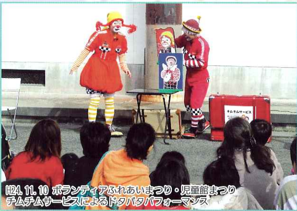
H24. 11. 10 ボランティアふれあいまつり・児童館まつり チームサービスによるドタバタパフォーマンス