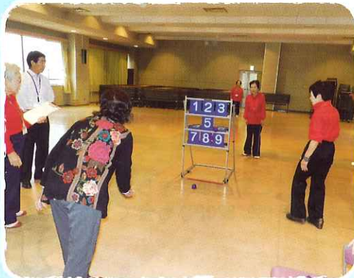
10月23日 北島町身体障害者連合会 運動会 めざせ 高得点！