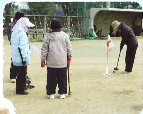
1月17日 社協会長杯グラウンドゴルフ大会 さあ、はいるかな