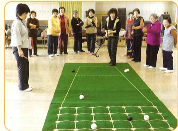
1月28日 囲碁ボール大会 優勝をめげせ!!