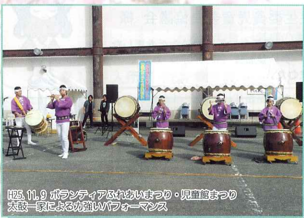
H25. 11. 9 ボランティアふれあいまつり・児童館まつり 太鼓一家による力強いパフォーマンス