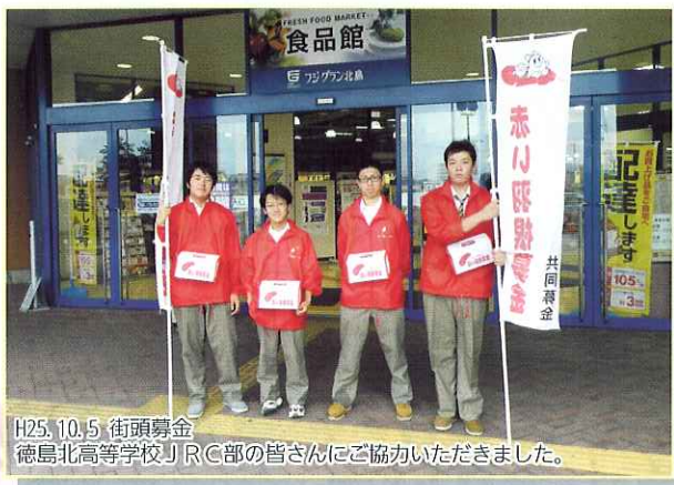
H25. 10. 5 街頭募金 徳島北高等学校JRC部の皆さんにご協力いただきました。