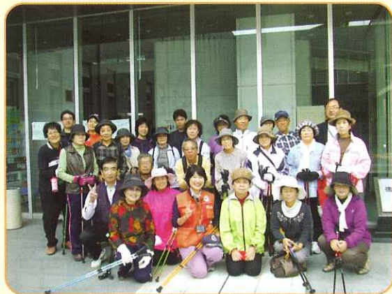
10月31日 ノルディック・ウォーク講習会 みんなそろって、はいポーズ!!