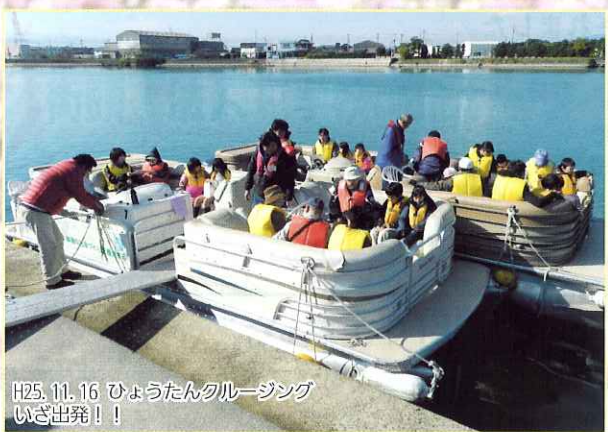
H25. 11. 16 ひょうたんクルージング いざ出発！！