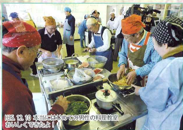
H25. 12. 10 本当にはじめての男性の料理教室 おいしくできました！！