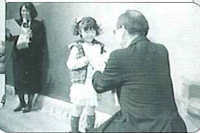
大抽選会 特賞当選