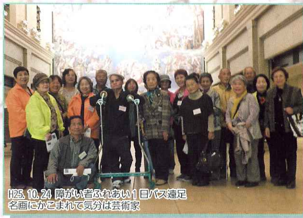
H25. 10. 24 障がい者ふれあい1日バス遠足 名画にかとまれて気分は芸術家