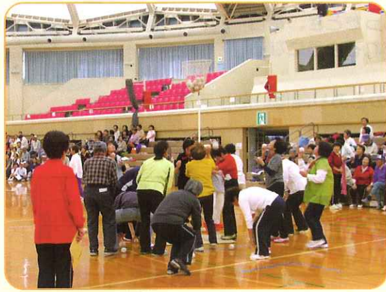
10月17日 北島町老人クラブ連合会小運動会 玉入れ いっぱい入れたかな？