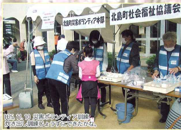
H25. 11. 10 災害ボランティア訓練 炊き出し訓練じょうずはできたかな。