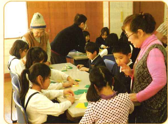
1月15日 北島わくわくキッズスクール 折り紙 何ができるかな