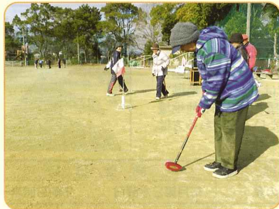
1月27日 社協会長杯 グラウンドゴルフ大会 めげせ、ホールインワン!!