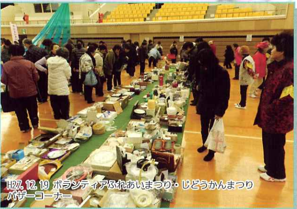
H27. 12. 19 ボランティアふれあいまつり・じどうかんまつり バザーコーナー