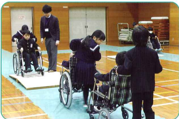
H28. 1. 29 北島北小学校 車イス講習会 うまくできるかな。