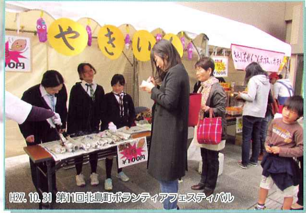
H27. 10. 31 第11回北島町ボランティアフェスティバル