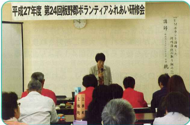
H27. 10. 8 第24回板野郡ボランティアふれあい研修会 EMボカシを利用した河川浄化研修中