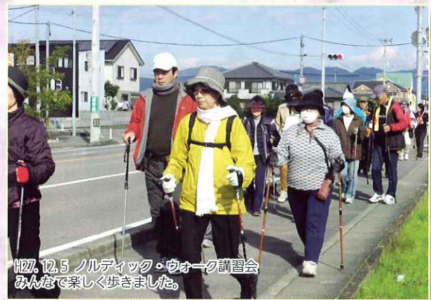
H27. 12. 5 ノルディック・ウォーク講習会 みんな楽しく歩きました。