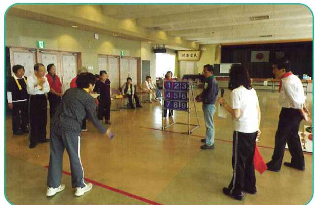
H27. 10. 22 北島町身体障害者連合会運動会 めざせ高得点