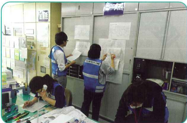
H27. 11. 15 災害ボランティア養成講座 北島町災害ボランティアセンター本部設置訓練