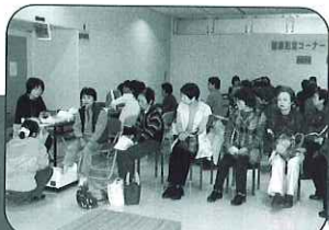
健康測定コーナー