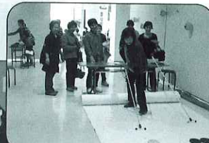
子どもチャレンジピック