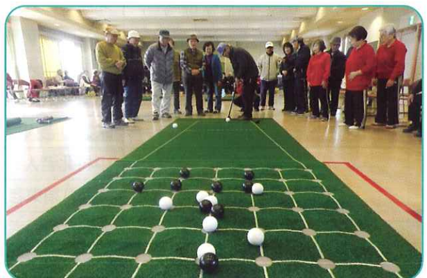
H28. 2. 2 第2回社協会長杯囲碁ボール大会 みんな がんばれ！