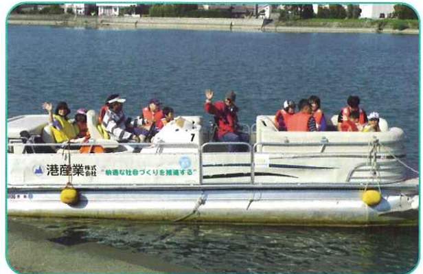
H27. 10. 4 ひょうたんクルージング いざ出発！！