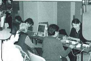
健康測定コーナー