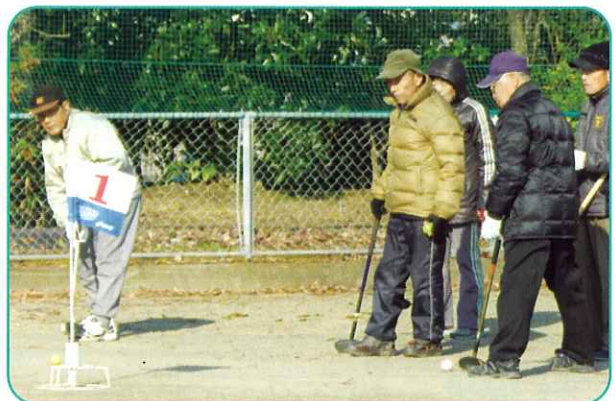
H28. 1. 21 第57回社協会長杯グラウンドゴルフ大会 うまく入るかな？