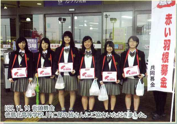
H27. 11. 14 街頭募金 徳島北高等学校JRC部の皆さんにご協力いただきました。