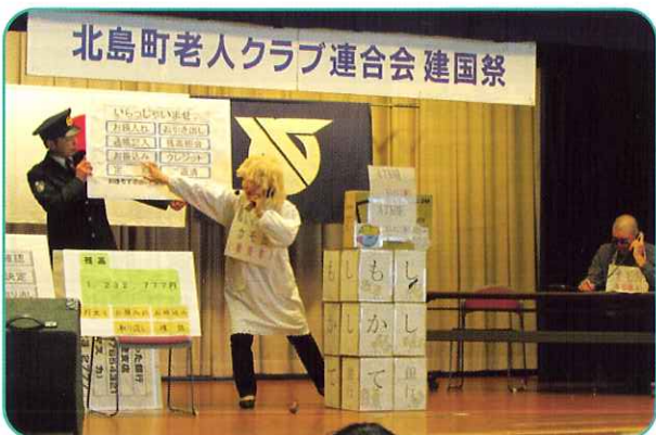
H28. 2. 10 北島町老人クラブ連合会 建国祭 振込め詐欺について勉強中！！