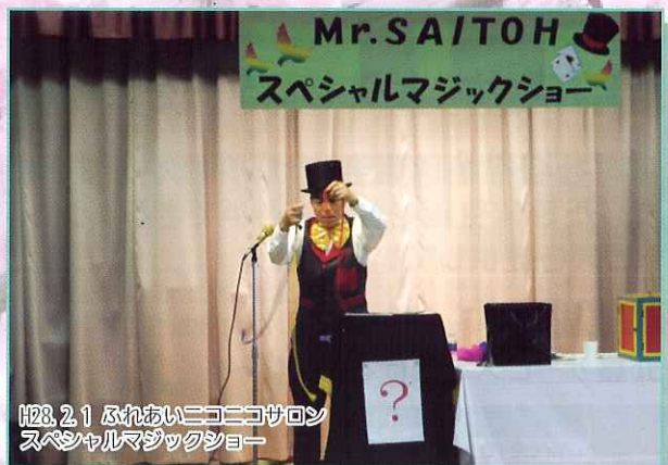
H28. 2. 1 ふれあいニコニコサロン スペシャルマジックショー