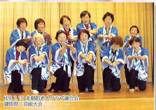
H28. 2. 10 北島町老人クラブ連合会 建国祭、芸能大会