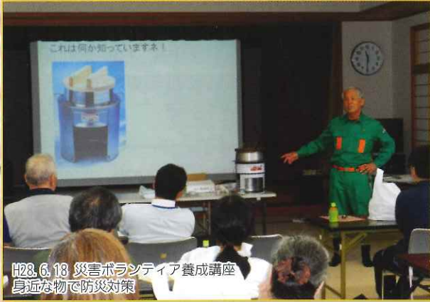
H28.6.18 災害ボランティア養成講座 身近な物で防災対策