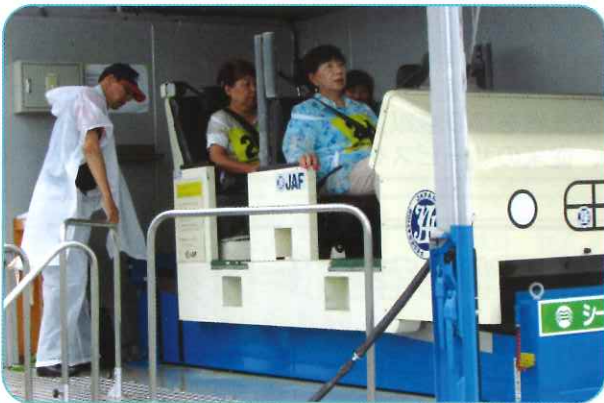
H28. 7. 13 シニアドライバー講習会 北島町老人クラブ連合会の方が参加してくれました。