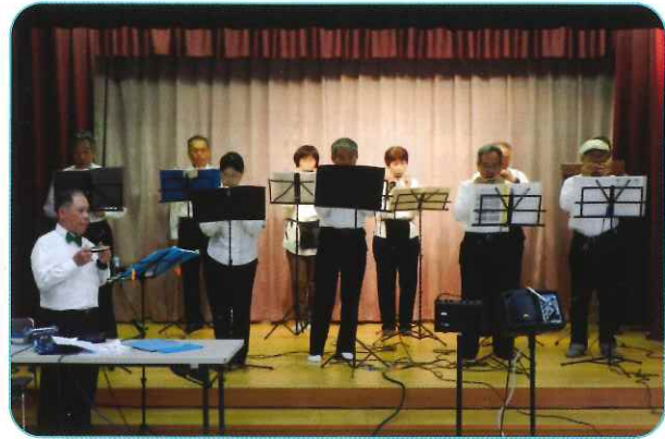
H28. 5. 9 ふれあいニコニコサロン ハーモニカクラブによる演奏会