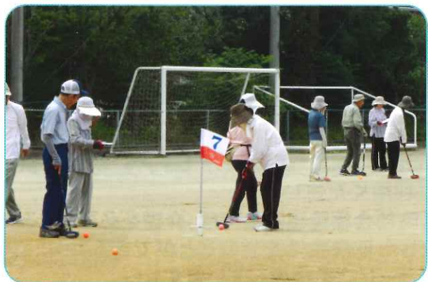
H28. 7. 26 第58回 社協会長杯グラウンドゴルフ大会 うまく入るかな？