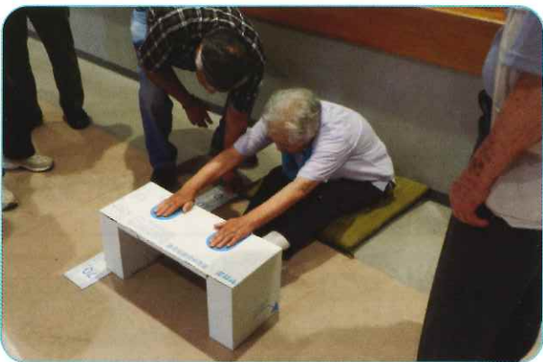
H28. 7. 28 健康フェスティバル 体やわらかいかな？