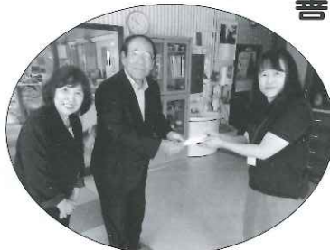
南海熱学工業株式会社 様

社協会費募集にあたり、各戸を訪問され奉仕された方(各地区婦人会役員、自治会・衛生組合役員、担当民生委員の各位)、そしてご協力くださった住民の方々に対して、厚くお礼申し上げます。お陰をもちまして 636,140円 が集まりました。(※28.8月末現在)この会費は、社協の自主財源として、より充実した福祉事業推進に役立てさせていただきます。