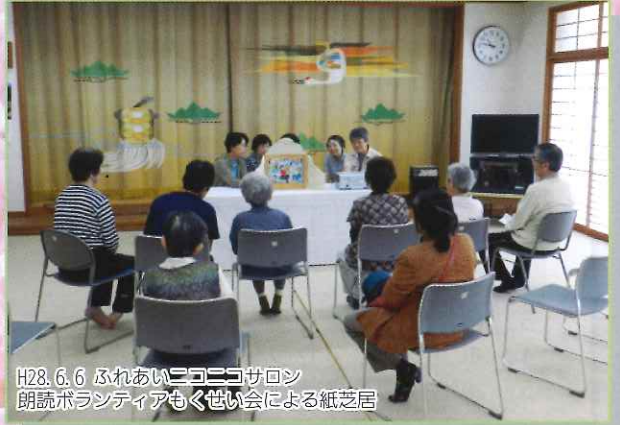
H28.6.6 ふれあいココロサロン 朗読ボランティアもくせい会による紙芝居