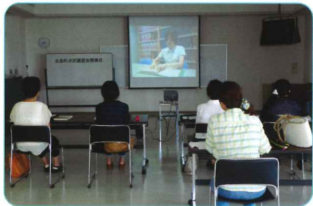
H28. 7. 5 北島町点訳講習会 点字について学んでいます。