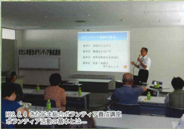
H28.8.4 きたじま総合ボランティア養成講座 ボランティア活動の基本とは...