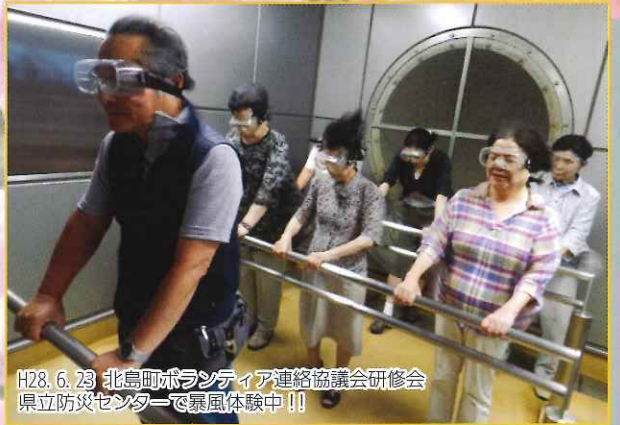
H28.6.23 北島町ボランティア連絡協議会研修会 県立防災センターで暴風体験中!!