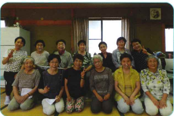
H28. 8. 22 小地区ふれあい会「なかよし会」 「アメ食い競争」にチャレンジ!! お顔が白くなりました。