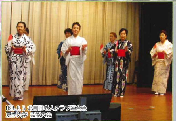
H28.8.5 北島町老人クラブ連合会 夏季大学 芸能大会