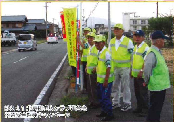
H28.9.1 北島町老人クラブ連合会 交通安全啓発キャンペーン