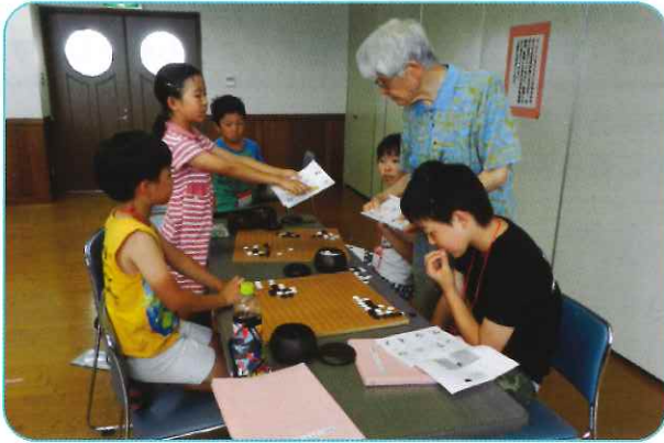
H28. 6. 11 北島わくわくキッズスクール囲碁 名人めざして勉強中