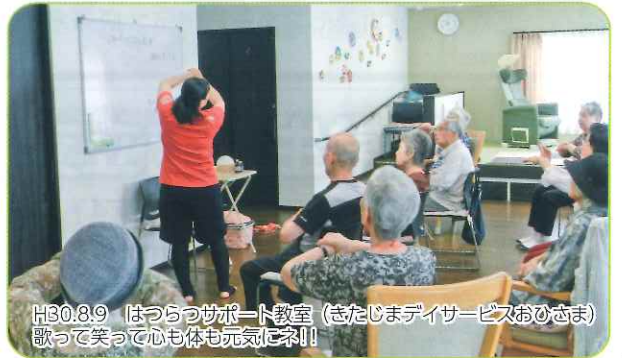
H30.8.9 はつらつサポート教室 (きたじまデイサービスおひさま) 歌って笑って心も体も元気に来!!