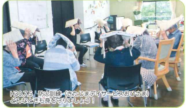
H30.7.5 防火訓練 (きたじまデイサービスおひさま) どんなときも身を守りましょう!