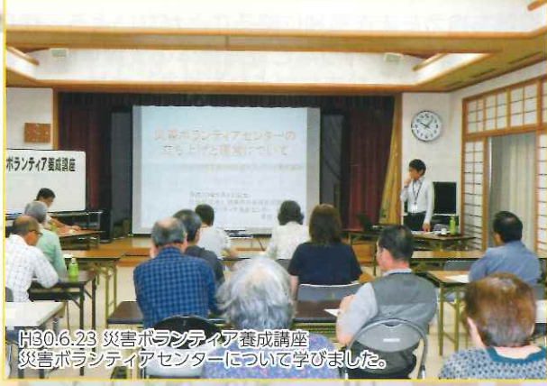
H30.6.23 災害ボランティア養成講座 災害ボランティアセンターについて学びました。