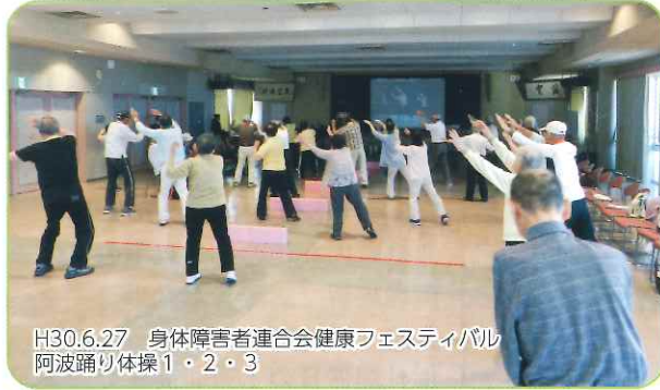
H30.6.27 身体障害者連合会健康フェスティバル 阿波踊り体操 1・2・3