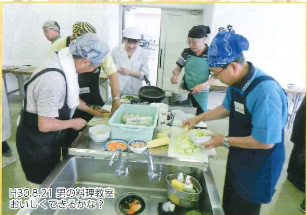
H30.8.21 男の料理教室 おいしくできるかな?