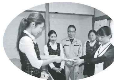
三和電業株式会社北島支店 様