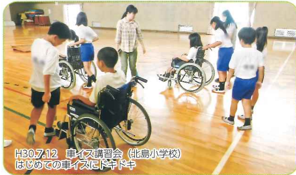
H30.7.12 車イス講習会 (北島小学校) はじめての車イスにドキドキ