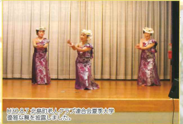
H30.8.7 北島町老人クラブ連合会夏季大学 優雅な舞を披露しました。