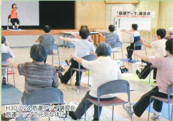
H30.7.24 筋力アップ講習会 筋力アップで元気な体に!