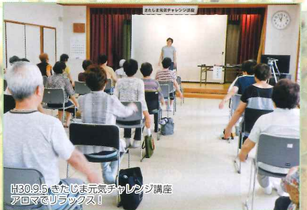
H30.9.5 きたじま元気チャレンジ講座 アロマでリラックス!