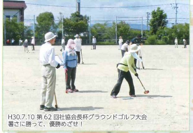
H30.7.10 第62回社協会長杯グラウンドゴルフ大会 暑さに勝って、優勝めざせ!