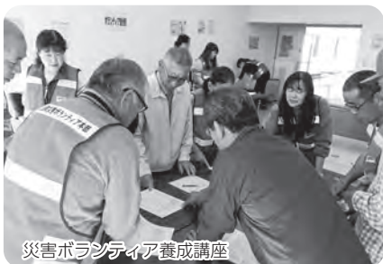
災害ボランティア養成講座