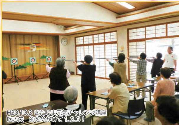
H30.10.3 きたじま元気チャレンジ講座 吹き矢 的のめがけて1.2.3!