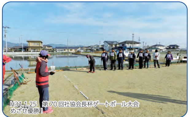
H31.1.25 第70回社協会会長杯グートボール大会 めざせ優勝！！