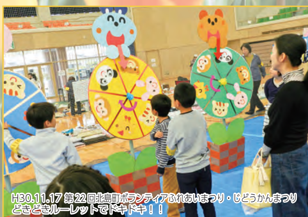
H30.11.17 第22回北島町ボランティアふれあいまつり・子どもかんまつり どきどきルーレットでドキドキ!!