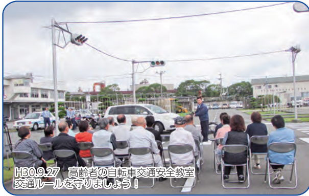
H30.9.27 高齢者の自転車交通安全教室 交通ルールを守りましょう！