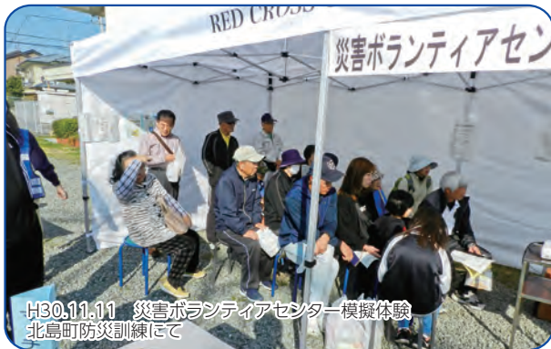
H30.11.11 災害ボランティアセンター模擬体験 北島町防災訓練にて