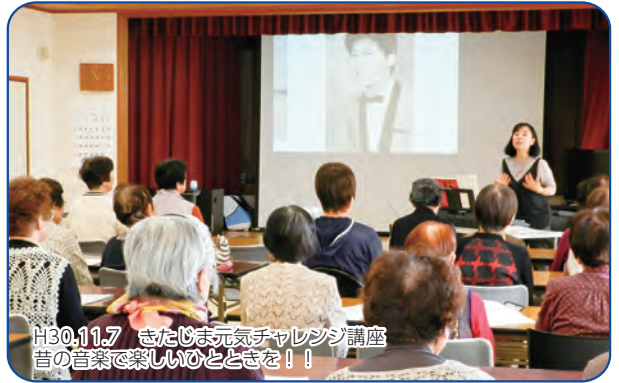
H30.11.7 きたじま元気チャレンジ講座 昔の音楽で楽しいひとときを！！