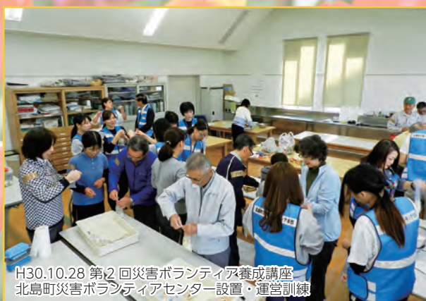
H30.10.28 第2回災害ボランティア養成講座 北島町災害ボランティアセンター設置・運営訓練