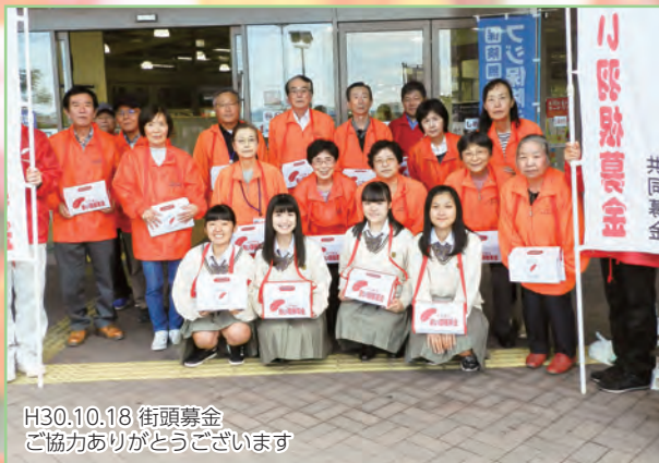
H30.10.18 街頭募金 ご協力ありがとうございます