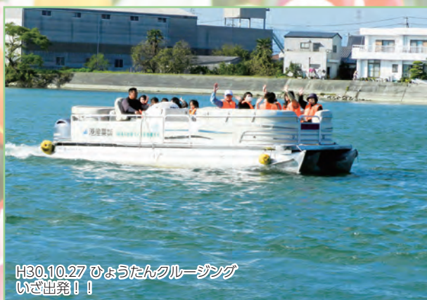
H30.10.27 ひょうたんクルージング いざ出発!!