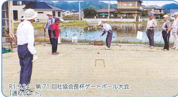
R1.9.24 第71回社協会長杯ゲートボール大会 【通れグランド】