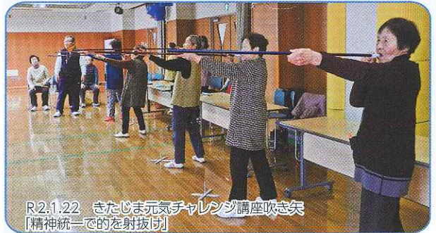
R2.1.22 きたじま元気チャレンジ講座吹矢 【精神統一のための射抜け】