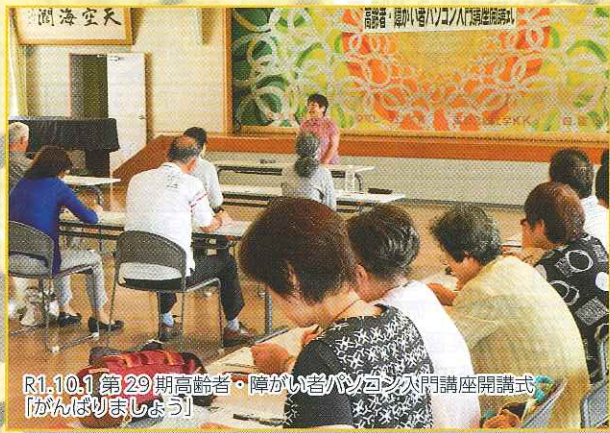
R1.10.1 第29期高齢者・障がい者パソコン入門講座開講式 「がんばりましょう」