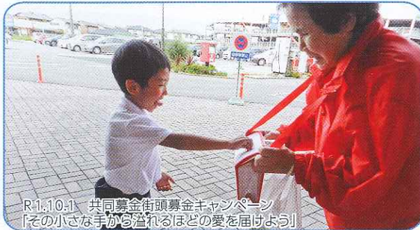
R1.10.1 共同募金街頭募金キャンペーン 【その小さな手が溢れるほどの愛を届けよう】