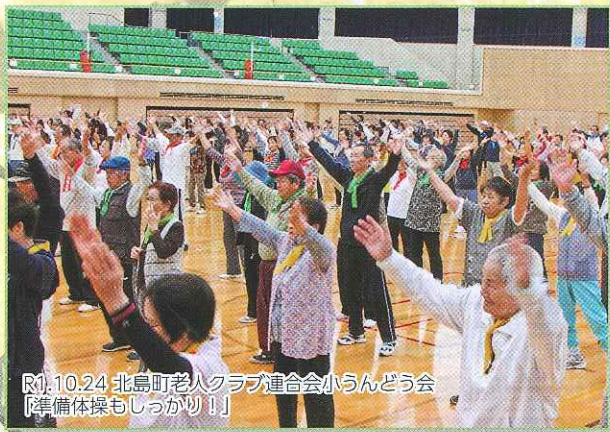
R1.10.24 北島町老人クラブ連合会小らんど会 「準備体操もしっかり!!」