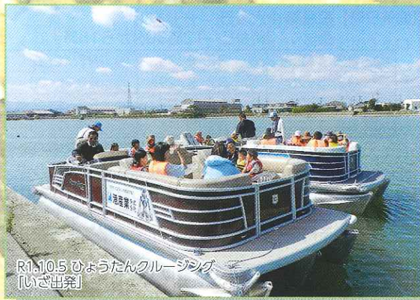
R1.10.5 ひょうたんクルージング 「いざ出発」