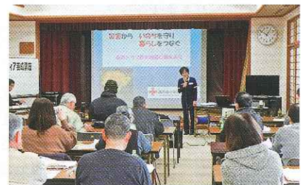
令和元年度第3回災害ボランティア養成講座の様子

※会員登録された方に、災害ボランティア養成講座等の案内を送付させていただきます。