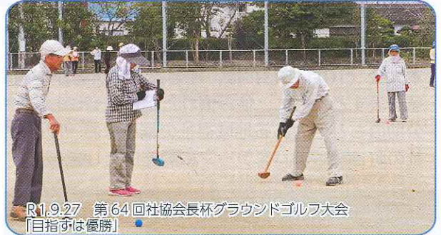
R1.9.27 第64回社協会長杯グラウンドゴルフ大会 【目指すは優勝】