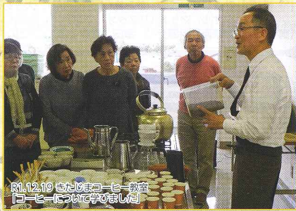
R1.12.19 きたじまコーヒー教室 「コーヒーについて学びました」