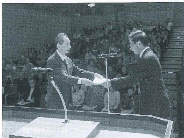
受賞おめでとうございます

本大会（10月19日）は、社会福祉関係者が一同に集い、社会福祉の発展に功績のあった方々に感謝の意を表すとともに、住み慣れた地域社会において様々な福祉ニーズに迅速に対応するため、自助・共助・公助のもと活力ある地域福祉の輪をなお一層広げるべく「新時代 みんなの力で つながる人の輪 福祉の町きたじま」をテーマに開催いたしました。