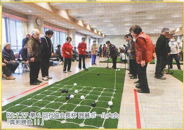
R2.1.27 第6回社協会長杯 田島ボール大会 「真剣勝負!!!」