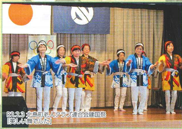
R2.2.3 北島町老人クラブ連合会建国祭 「楽しい舞でした」