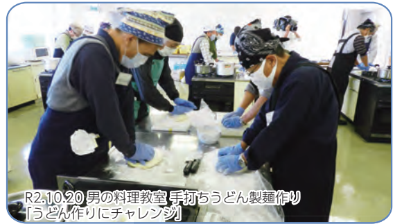
R2.10.20 男の料理教室 手打ちうどん製麺作り 【うどん作りにチャレンジ!】