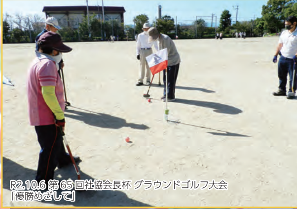
R2.10.6 第65回社協会長杯 グラウンドゴルフ大会 【優勝めざして】