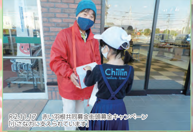
R2.11.17 赤い羽根共同募金街頭募金キャンペーン 【小さな力に支えられています】