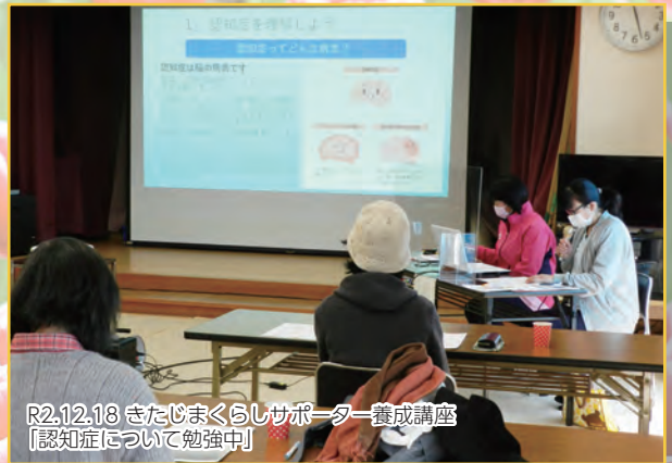
R2.12.18 きたじまくらしサポーター養成講座 【認知症について勉強中】