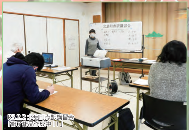
R3.2.2 北島町点訳講習会 【修了作品作成中!!!】