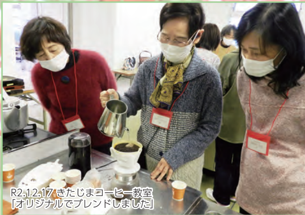
R2.12.17 きたじまコーヒー教室 【オリジナルでブレンドしました】