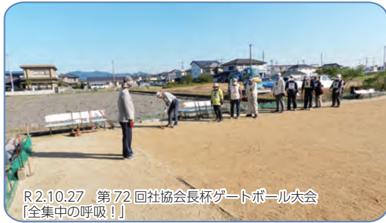
R2.10.27 第72回社協会長杯ゲートボール大会 【全集中の呼吸!】