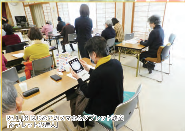
R3.1.18 はじめてのスマホ&タブレット教室 【タブレットの達人】