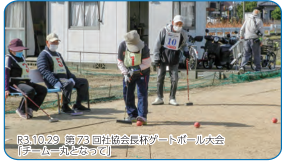
R3.10.29 第73回社協会長杯ゲートボール大会 「チーム一丸となって」