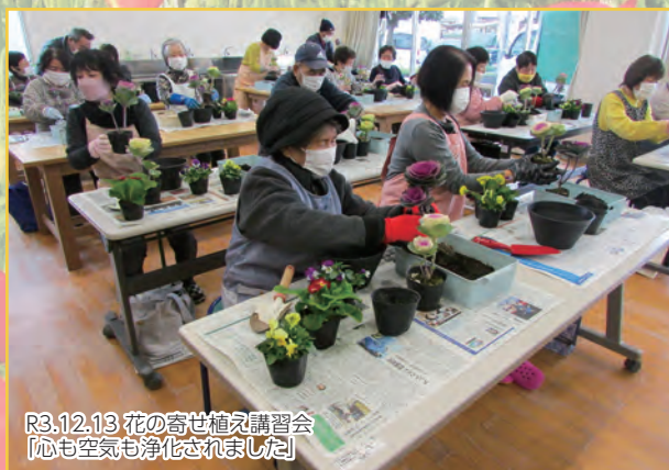
R3.12.13 花の寄せ植え講習会 【心も空気も浄化されました】