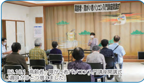
R3.10.1 高齢者・障がい者パソコン入門講座開講式 「趣味がひとつ増えました」