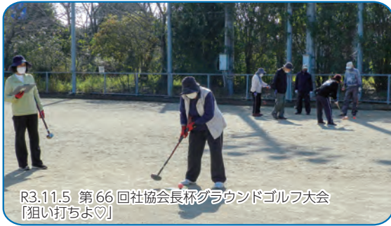
R3.11.5 第66回社協会長杯グラウンドゴルフ大会 「狙い打ちよ」