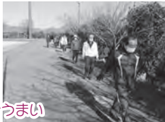
～最終日～ 姿勢も正しい、空気がうまい