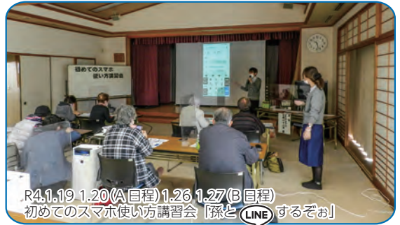
R4.1.19 1.20(A日程) 1.26 1.27(B日程) 初めてのスマホ使い方講習会「孫とLINEするぞ!」