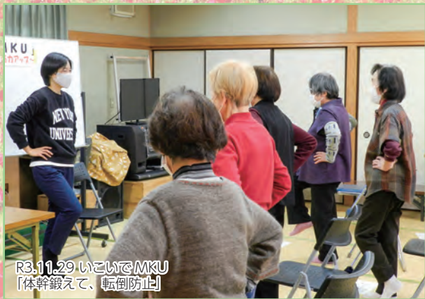
R3.11.29 いこいでMKU 【体幹鍛えて、転倒防止】