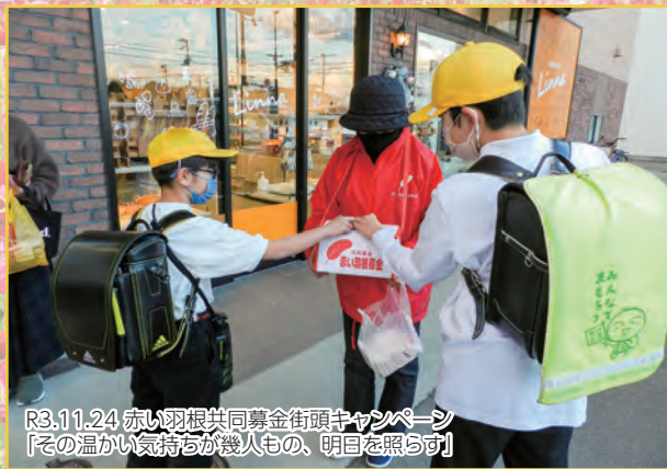
R3.11.24 赤い羽根共同募金街頭キャンペーン 【その温かい気持ちが幾人もの、明日を照らす】