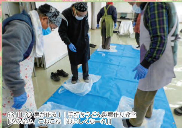
R3.11.30 男が作る！！手打ちうどん製麺作り教室 【ふみふみ、こねこね「おいしくな〜れ！」】