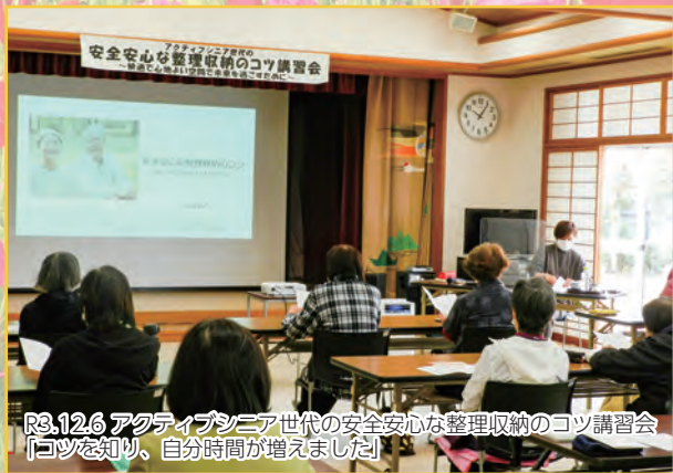
R3.12.6 アクティブシニア世代の安全安心な整理収納のコツ講習会 【コツを知り、自分時間が増えました】