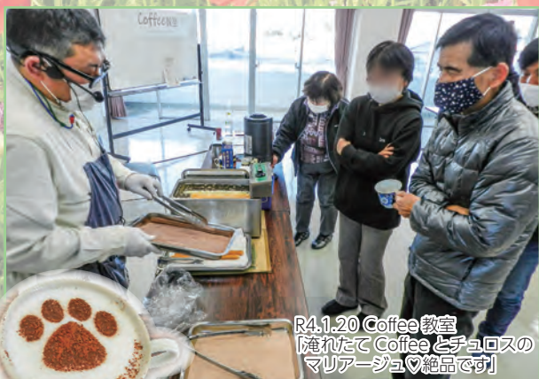
R4.1.20 Coffee教室 【淹れたてCoffeeとチョコロスの マリアージュ♡絶品です】