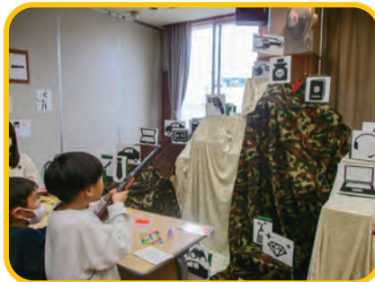
キッズスナイパー