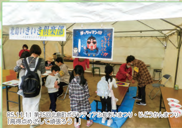
R5.11.11 第25回北島町ボランティアふれあいまつり・もどろかんまつり 「高得点めざして頑張ろう!!」