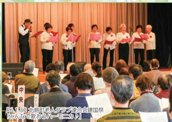
R6.1.30 北島町老人クラブ連合会建国祭 「みんなで歌おうハーモニカ」