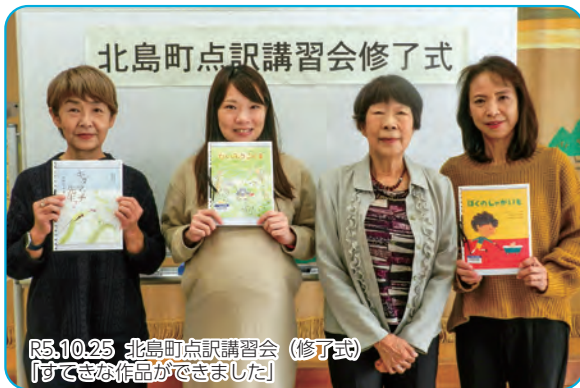
R5.10.25 北島町点訳講習会（修了式） 「できた作品ができました」