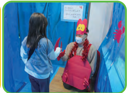
アンダー・ザ・シー