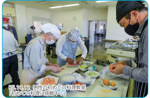
R5.10.12 男性の初めての料理教室 「初めての料理に挑戦中！」