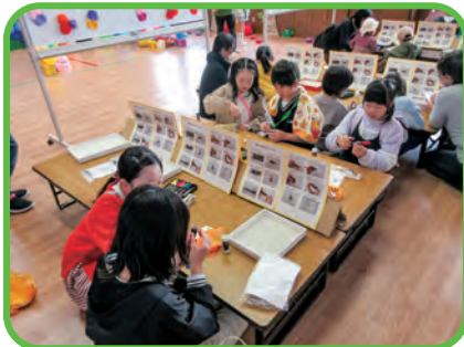
制作「魔法のたまご」