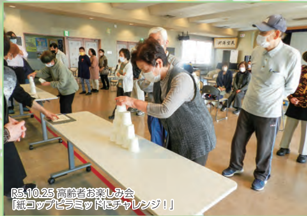
R5.10.25 高齢者お楽しみ会 「紙コップピラミッドにチャレンジ!!」