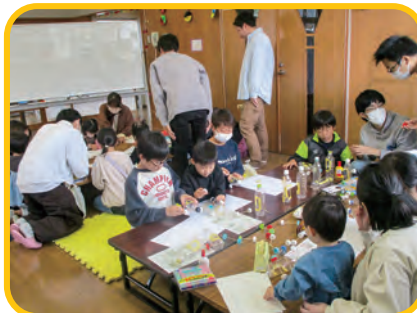
イノベものづくり工房