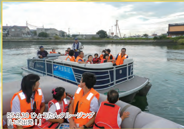
R5.9.30 ひょうたんクルージング 「いざ出発!!」