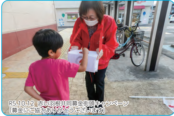
R5.10.12 赤い羽根共同募金街頭キャンペーン 「募金にご協力ありがとうございます」