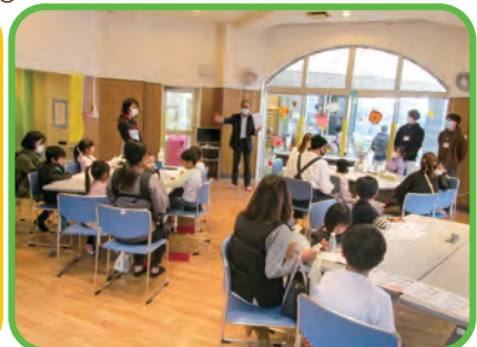
未来のクルマのエネルギー