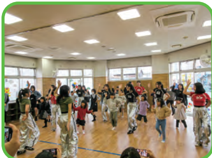
高校生によるダンスパフォーマンス