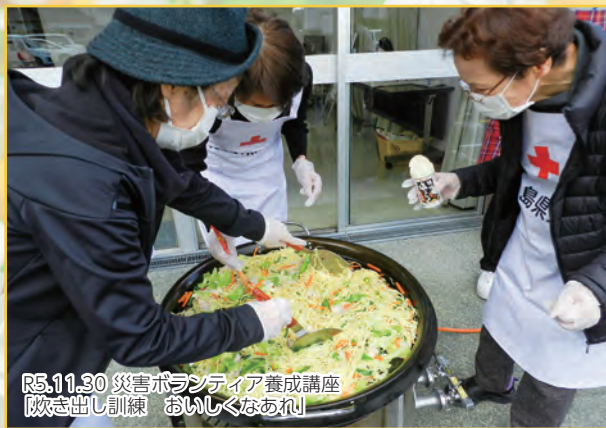
R5.11.30 災害ボランティア養成講座 「炊き出し訓練 おいしくなあれ」