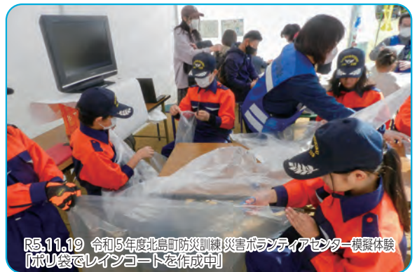
R5.11.19 令和5年度北島町防災訓練 災害ボランティアセンター模擬体験 「ポリ袋でレインコートを作成中」