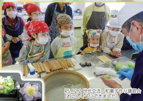
R5.12.2 世代交流 和菓子作り講習会 「おいしそうにできました」