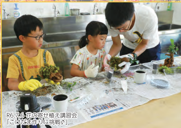
R6.7.6 花の寄せ植え講習会 「こけだま作りに挑戦!」