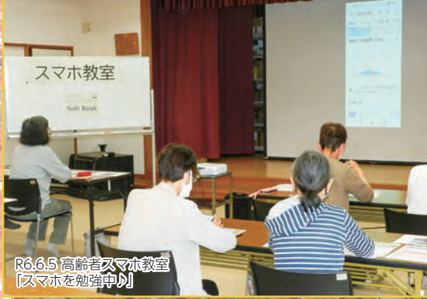
R6.6.5 高齢者スマホ教室 「スマホを勉強中!」