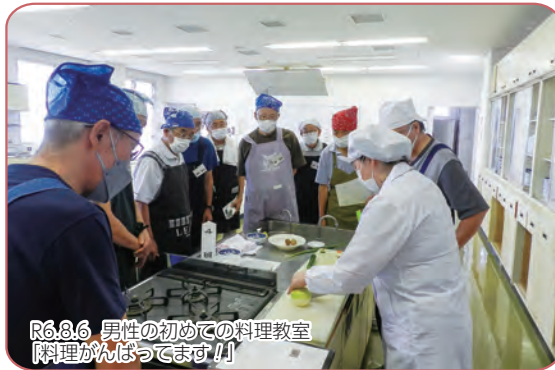
R6.8.6 男性の初めての料理教室 「料理ががんばってます!!」