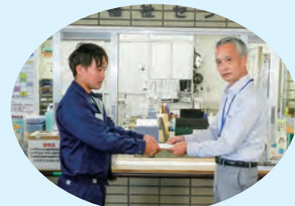
三和電業株式会社北島支店 様

公益財団法人 藤井財団 様 町内5児童館にDVDセット、 手引書をご寄附いただきました。