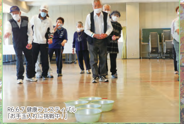
R6.6.7 健康フェスティバル 「お手玉入れに挑戦中!」