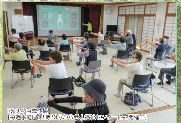
R6.9.4 百歳体操 「毎週水曜日13時30分から老人福祉センターにて開催中!」