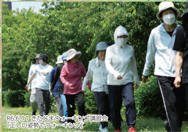
R6.6.11 きたじまウォーキング講習会 「正しい姿勢でウォーキング」