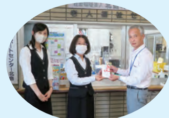
三和プラントエンジニアリング株式会社 様