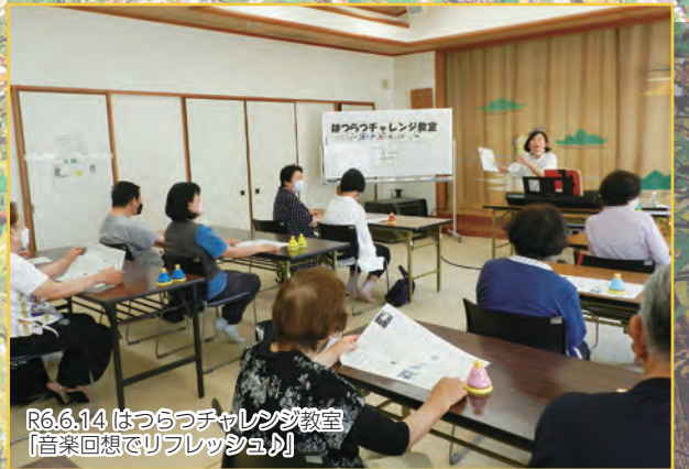
R6.6.14 はつらつチャレンジ教室 「音楽回想でリフレッシュ!」