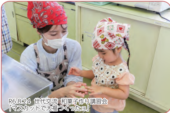
R6.8.24 世代交流、和菓子作り講習会 「マスクットで犬福つくったヨ」