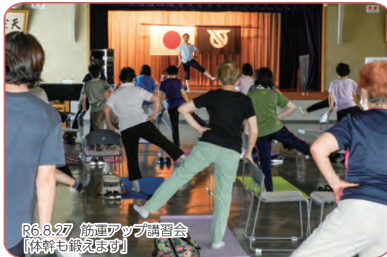
R6.8.27 筋力アップ講習会 「体幹も鍛えます」