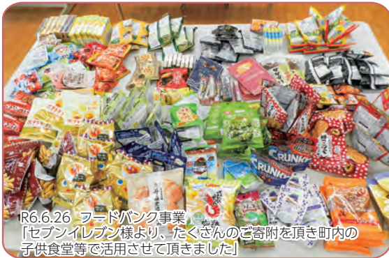
R6.6.26 フードバンク事業 「セブンイレブン様より、たくさんのご寄附を頂き町内の 子供食堂等で活用させて頂きました」