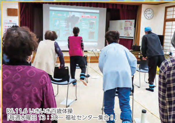
R6.11.6 いきいき百歳体操 【毎週水曜日 13:30～ 福祉センター集合!!】