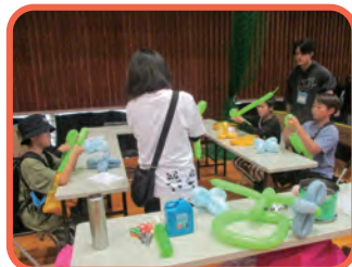
バルーンアーティスト体験