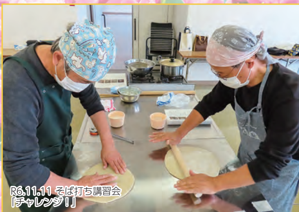
R6.11.11 そば打ち講習会 【チャレンジ!!】