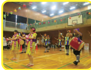
エイサーのパフォーマンス