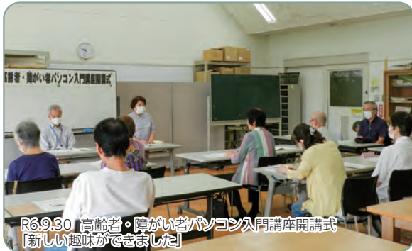
R6.9.30 高齢者・障がい者パソコン入門講座開講式 「新しい趣味ができました」