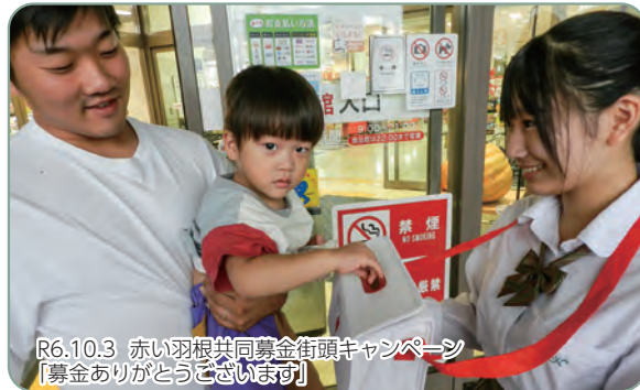
R6.10.3 赤い羽根共同募金街頭キャンペーン 「募金ありがとうございます」