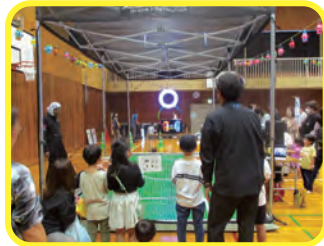
ドローンサッカー