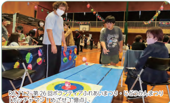
R6.11.2 第26回ボランティアふれあいまつり・ひょうごかんまつり 「ポッチャマン!!めざせ1億点」