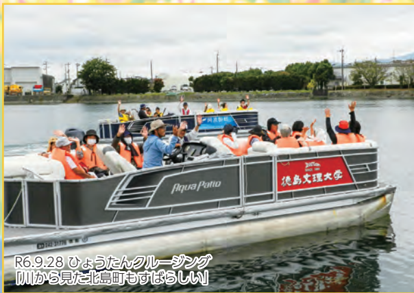
R6.9.28 ひょうたんクルージング 川から見た北島町もすばらしい!