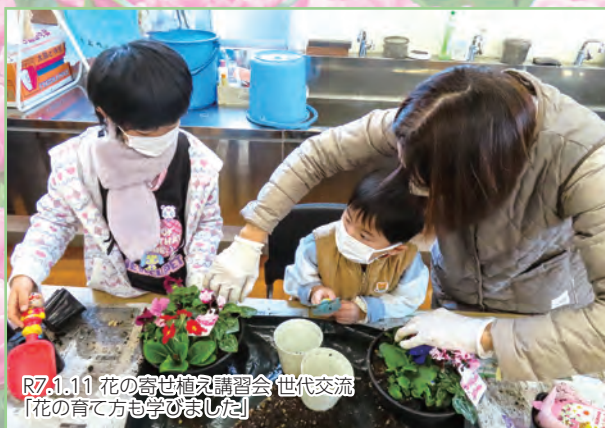
R7.1.11 花の寄せ植え講習会 世代交流 【花の育て方も学びました!】