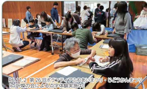
R6.11.2 第26回ボランティアふれあいまつり・ひょうごかんまつり 「点訳の会による点字体験実施中」