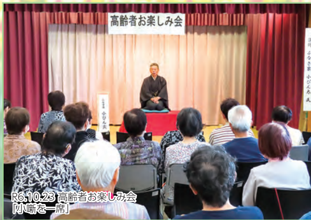
R6.10.23 高齢者お楽しみ会 【断髪を一席】