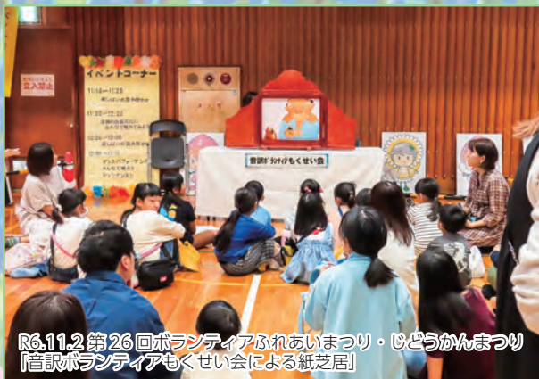
R6.11.2 第26回ボランティアふれあいまつり・じどうかんまつり 【信託ボランティアもくせい会による紙芝居】