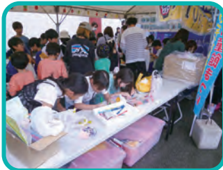
制作「UKI UKI かざぐるま」