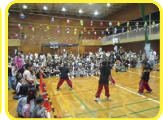
ダンスパフォーマンス