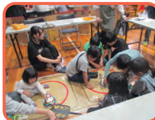
ロボットプログラミング体験