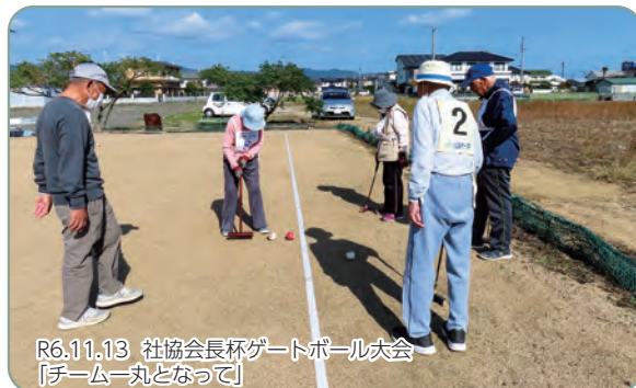
R6.11.13 社協会長杯ゲートボール大会 「チーム丸となって」