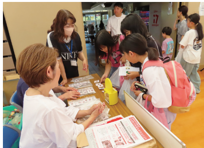
R7.9.27 ボランティアふれあいまつりに出店