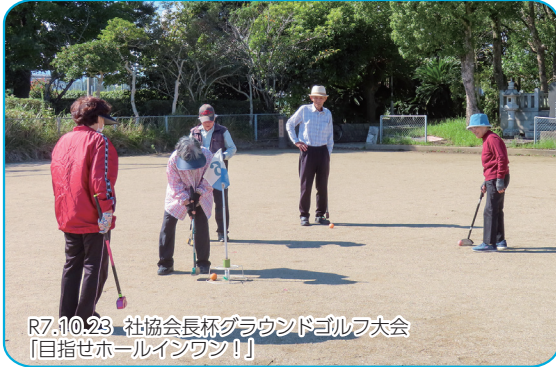
R7.10.23 社協会長杯グラウンドゴルフ大会 「目指せホールインワン！」