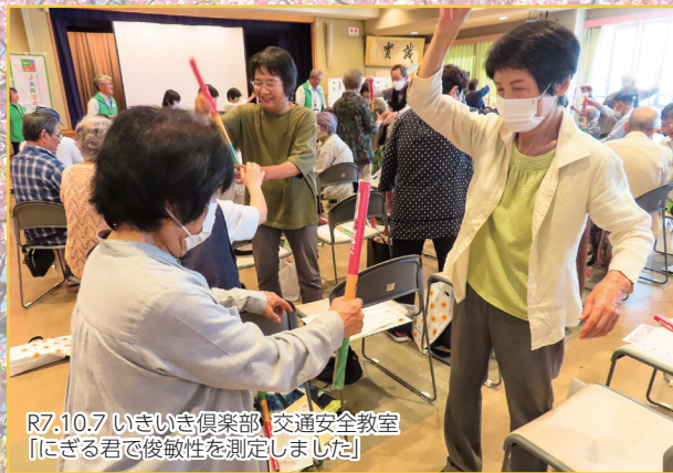
R7.10.7 いきいき倶楽部 交通安全教室 「にぎる君で俊敏性を測定しました」