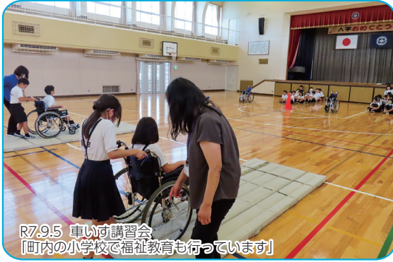
R7.9.5 車いす講習会 「町内の小学校で福祉教育も行っています」