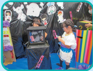
ドキドキおぼけハウス