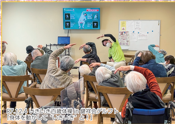
R7.12.4 いきいき百歳体操in健祥会アルフト 「身体を動かして“いきいき”と!!」