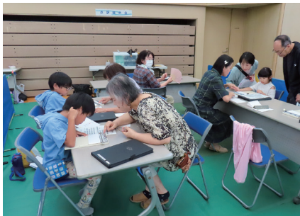
R7.9.27 点訳燦の会による点字体験