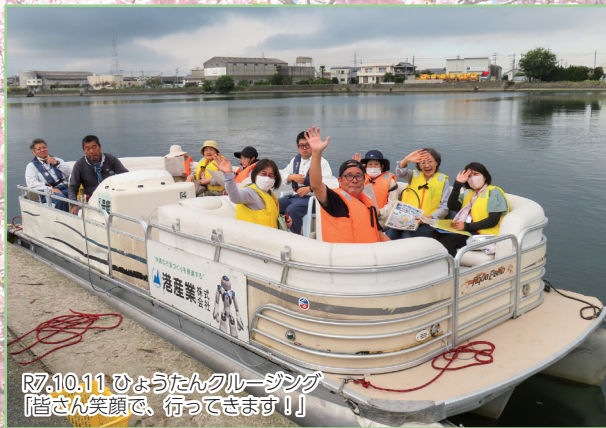
R7.10.11 ひょうたんクルージング 「皆さん笑顔で、行ってきます!!」