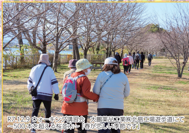
R7.12.9 ウォーキング講習会 大鵬薬品工業(株)北島工場遊歩道にて ～500本を超える桜並木～「春が恋しい季節です」