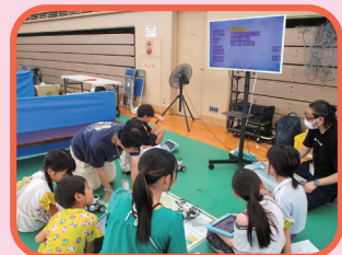
ロボットプログラミング体験