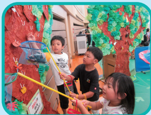
めざせ! 虫とりめいじん