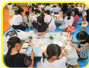
木切れを使って遊ぼう!