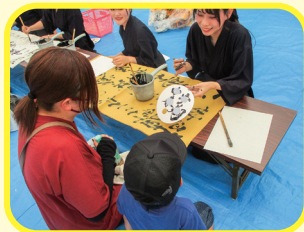
書道パフォーマンス&ワークショップ