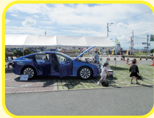
水素で走るクルマ!? 「MIRAI」を体感