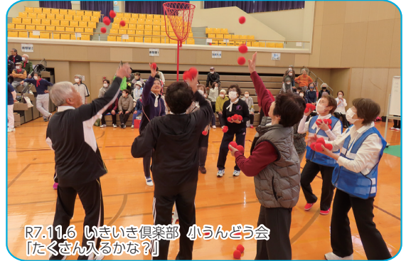
R7.11.6 いきいき倶楽部 小らんどう会 「たくさん入るかな？」