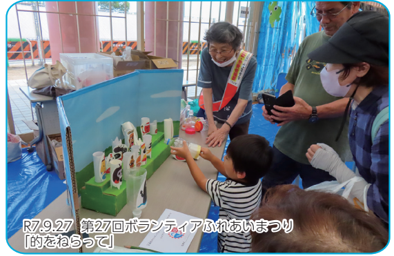
R7.9.27 第27回ボランティアふれあいまつり 「的をねらって」