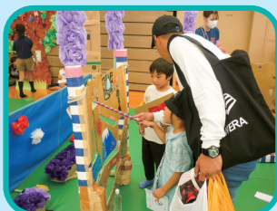
ギリギリチャレンジ