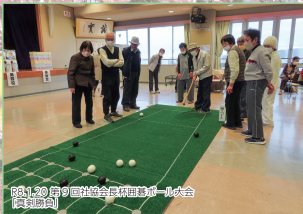
R8.1.20 第9回社協会長杯囲碁ボール大会 「真剣勝負」