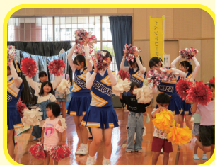
みんなで楽しく踊ろう! レッツチアダンス!