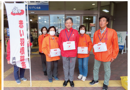
R7.10.21 商業施設での募金啓発に協力