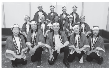
R7.10.22 とくしま健康福祉のつどいに出場

新春行事として、お笑い福祉士による講演と芸能大会を開催し、139名が参加しました。衣装や演出に工夫を凝らしたデュエット曲の披露もありました!