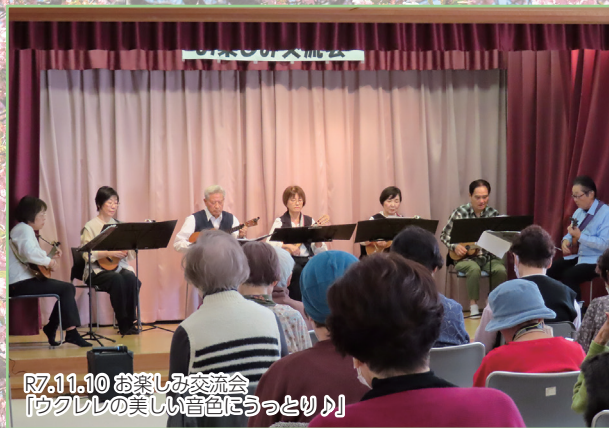
R7.11.10 お楽しみ交流会 「ウクレレの美しい音色にうっとり」