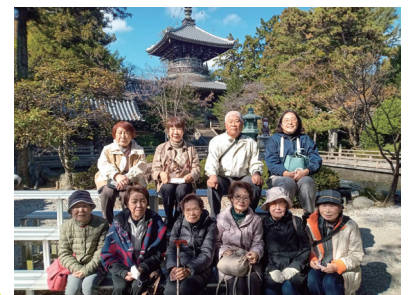
R7.11.19 第一番札所 霊山寺にて

2年ぶりにボランティア研修会を開催し、所属グループの垣根を越えて、交流を図りました！