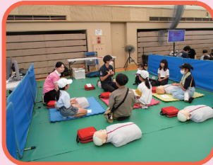
赤十字救急法体験